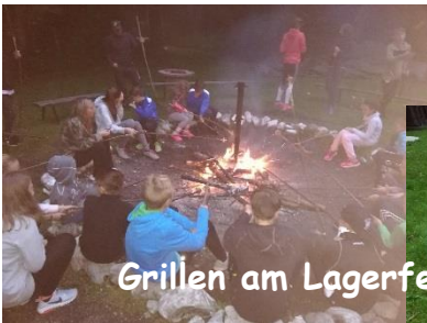
Grillen am Lagerfeuer