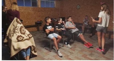
Disco mit Herzblatt & Showacts