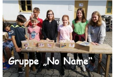
Gruppe „No Name“