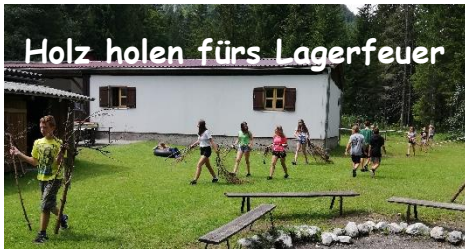
Holz holen fürs Lagerfeuer