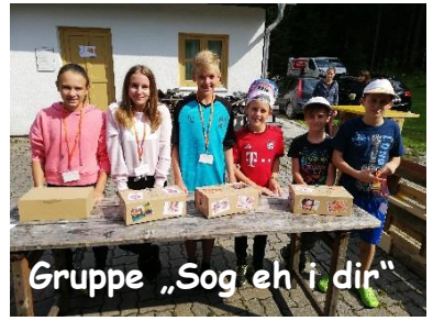
Gruppe „Sog'eh i dir“